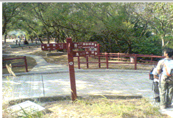
H014 選右邊往山頂方向