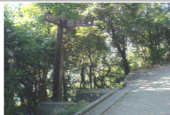
H015 選左邊樓梯入小路