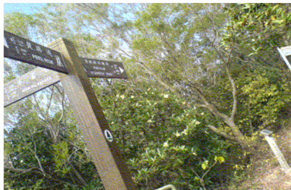
H018 繼續向前往薄扶林水塘